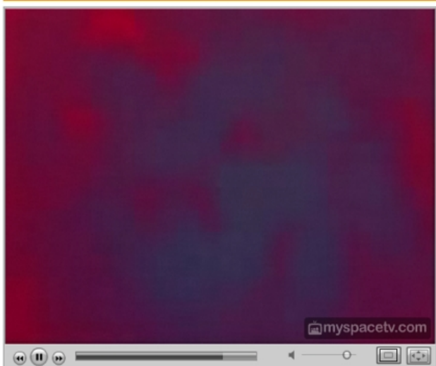
Vidéo de Steve Stuart