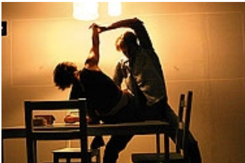
Tanzcompagnie Gießen/ José María Alvès: Blanche / dance performance installation (Premiere)

Blanche est une vision panoramique d'une maison de 34 m de long. Il propose de changer la relation entre danseurs, public et espace. Le public est amené à suivre les actions d'une journée qui se présentent à lui dans l'espace.